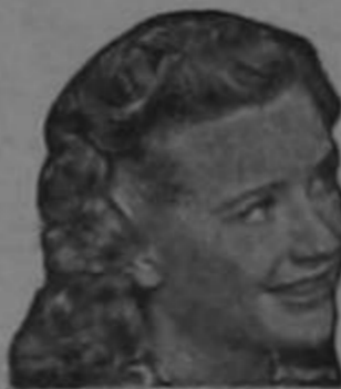
Priscilla Lane de la Warner Bros

DE VENTA EN TODAS LAS BOTICAS Y DROGUERIAS