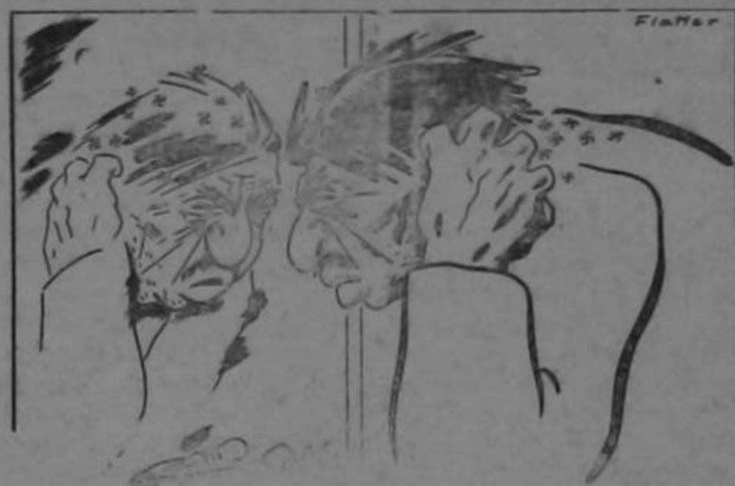
El que con perros se junta, de pulgas se llena