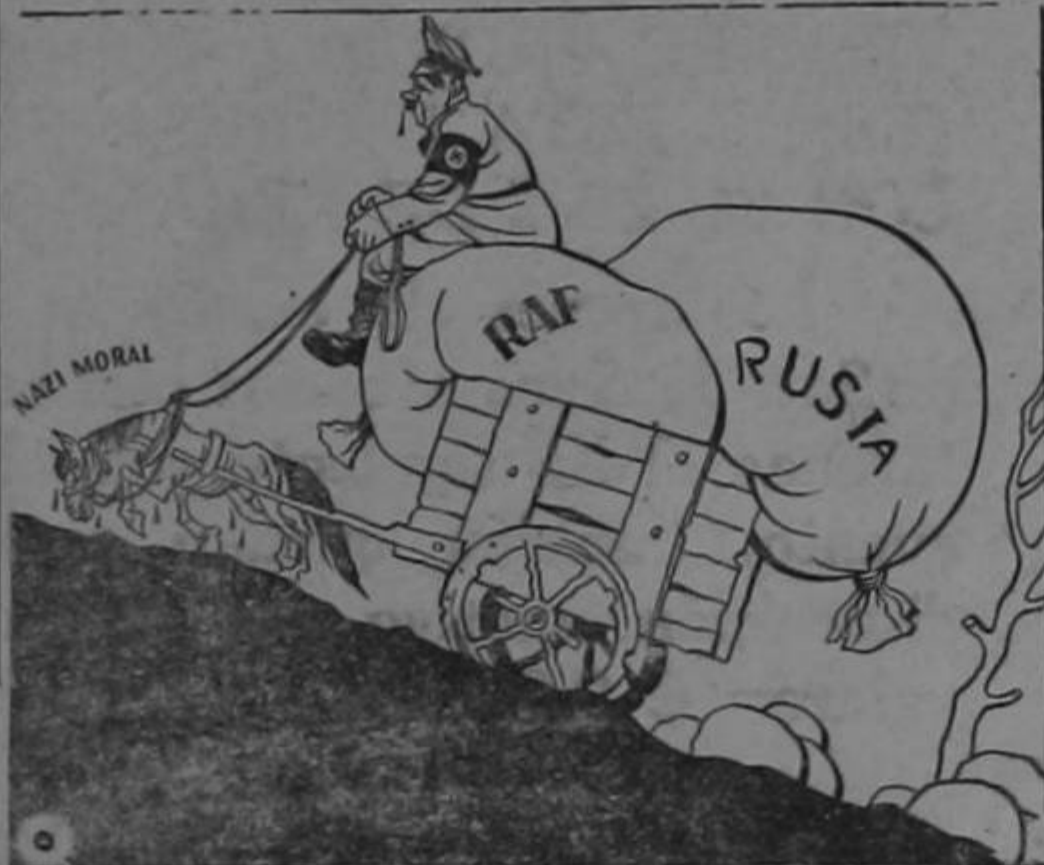
EL ROCIN EMPIEZA A FLAQUEAR

Bueno, pero que conste que esos comentarios los oímos cuando se hablaba de las posibilidades del cortesismo. Ahora ya no. Nada de forros!