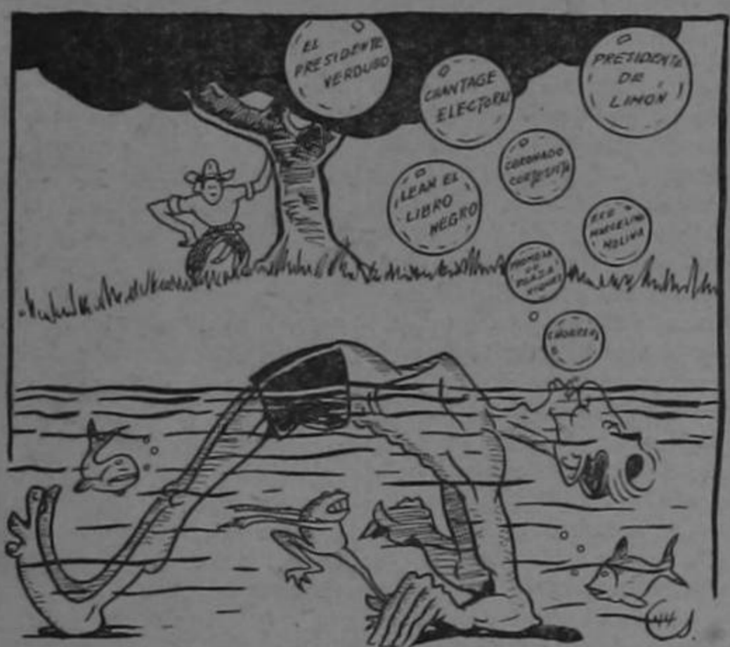
LOS ULTIMOS GASES

Teníamos el firme propósito de no volver a citar nunca más a don León Cortés ya que el domingo pasado lo llevaron al cementerio de los políticos, pero ahora resulta que desde ultratumba nos manda noticias. Invocado en una sesión espiritista dijo que él no reconocía a don Teodoro Picado como Presidente de Costa Rica y el universo se ha conmovido... El gobierno, el poder judicial, el clero, la cámara de diputados y el cuerpo diplo-