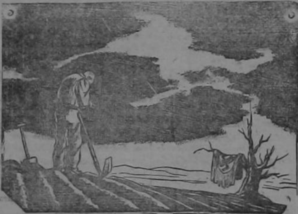
(Jorge VI de Inglaterra, Navidad 1943)